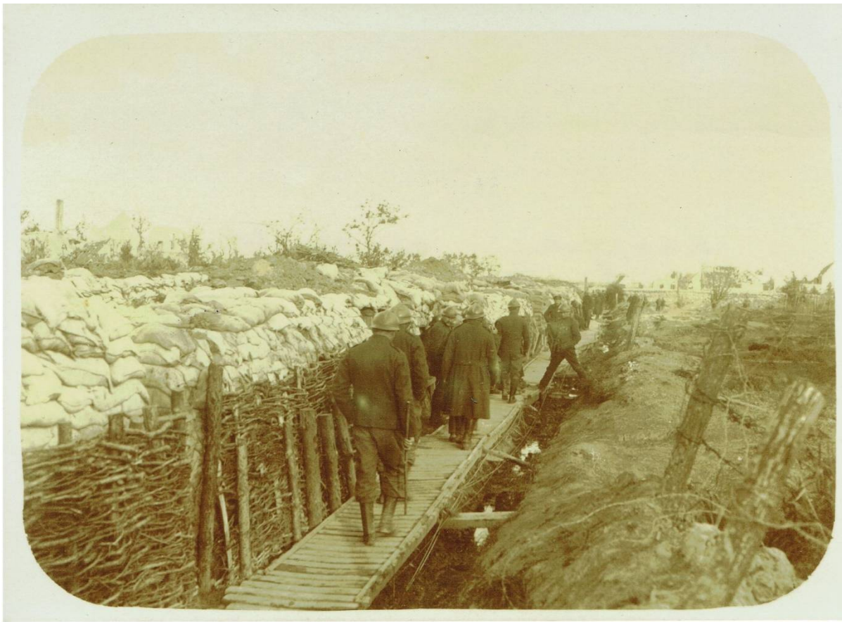
Figuur 1: Onuitgegeven fotootje van loopgraven op de spoorwegberm bij Nieuwpoort

Piet Van San Studiekring Wereldoorlog I en II Overijse Kersttijd 2014