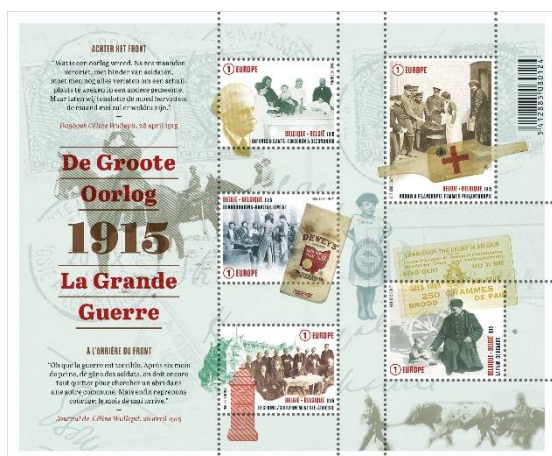
23.03.2015 De Grote Oorlog – deel 2 Achter het front